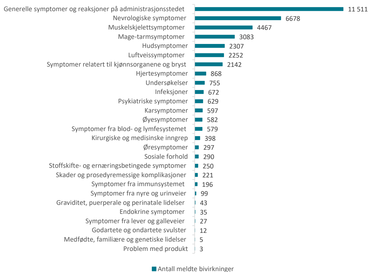
Figur 1: Meldte mistenkte bivirkninger fordelt etter kategori Comirnaty og Spikevax

De hyppigst meldte symptomene etter mRNA-vaksinene er hovedsakelig kjente bivirkninger i kategorien "Generelle symptomer og reaksjoner på administrasjonsstedet": reaksjoner på injeksjonsstedet eller i vaksinasjonsarmen, nedsatt allmenntilstand, feber, generell sykdomsfølelse, hodepine, svimmelhet, søvnighet, diaré, kvalme og oppkast. Symptomene er oppstått i løpet av 1-2 dager etter vaksinasjon, og er som regel gått over i løpet av noen få dager.