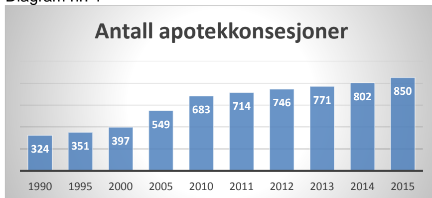
Diagram nr. 1

Figuren viser antall apotekkonsesjoner ved årsskiftet 31.12. Fra 2014 til 2015 økte antallet med 48. 52 nye apotek ble opprettet, mens 4 apotek ble avvirket. Fra 1990 til 2015 har antall apotek økt med 526 til 850.